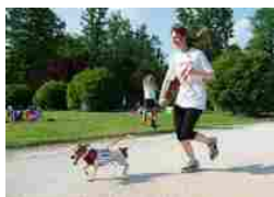
Milano, Advantix Running con i cani e