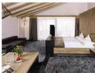
Una delle 18 eco Deluxe-Family Suite declinate in legno.

A Green Story è la collezione di Oltre con un impatto positivo sul nostro pianeta. 14 capi proposti sono in denim eco-sostenibile e in eco-viscosa proveniente da fonti di legno rinnovabile. La tela Vicunha, in cotone riciclato, riduce del 95 per cento il consumo di acqua e la tecnica Wiser wash usata nel processo di "sbiancatura" dei jeans taglia del 90 per cento l'uso di sostanze chimiche tossiche. Le etichette sono in cuoio rigenerato, in carta organica e in carta prodotta dagli scarti dei kiwi. oltre.com