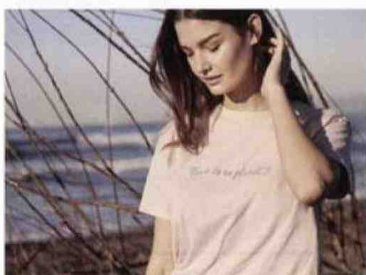
Una maglia in eco-viscosa della collezione green di Oltre.

Il Teatrino più piccolo del mondo a Vetriano (Lu), in Toscana. L'Antica Barberia Giacalone, tra i carruggi di Genova. E, ancora, il Giardino della Kolymbethra, un gioiello archeologico nella valle dei Templi di Agrigento. Sono alcuni dei beni protetti dal Fondo Ambiente Italiano affinché tutti possano viverli. In occasione della 28esima edizione delle Giornate Fai di Primavera, il 21 e 22 marzo, partecipa alla raccolta fondi per preservare il nostro patrimonio artistico programmando una visita ai castelli, torri e palazzi di solito inaccessibili, che apriranno eccezionalmente le porte ai visitatori. Come il cantiere della Torre PwC progettata da Daniel Libeskind a Citylife, il grattacielo "Curvo" che con i suoi 28 piani e 175 metri di altezza andrà a completare lo skyline di Milano. O al seicentesco Palazzo Moroni di Bergamo entrato a far parte del Fai proprio nel 2020. Da programmare anche le visite ai piccoli borghi come Santa Maria di Agira (En), tra i centri siciliani più antichi che regala un panorama incantevole sui vicini Nebrodi. Per scoprire i 1.150 luoghi delle 430 città che hanno aderito vai su: www.giornatefai.it