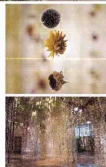
Sopra: la cascata di fiori Community al Toledo Museum of Art negli Usa. In alto: particolare di Life in Death , composta da oltre mille ghirlande di fiori che ha fatto pendere dal soffitto della Shirley Sherwood Gallery, nei Kew Gardens, a Londra.

www.rebeccalouiselaw.com www.parma2020.it